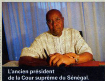
L'ancien président de la Cour suprême du Sénégal.

Dix ans après l'exposition des œuvres d'Ousmane Sow sur le pont des Arts, à Paris, la maison de ventes aux enchères Christie's s'apprête à mettre en vente onze sculptures de l'artiste sénégalais. Les collectionneurs et les musées pourront acquérir des « Noubas » (dont le Nouba debout exposé à Venise pour le centenaire de la Biennale), des « Masai » et une pièce de la série des « Zoulou ». L'ensemble est estimé entre 750 000 euros et 1 million d'euros.