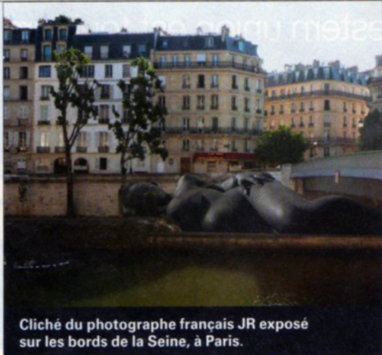
Cliché du photographe français JR exposé sur les bords de la Seine, à Paris.

Le photographe français JR a pour habitude d'exposer ses immenses clichés en plein air. Du 3 octobre au 2 novembre, trois expositions lui seront consacrées dans Paris, notamment autour de l'île Saint-Louis, où ses photos de la série « Women are Heroes » seront affichées en grand format sur les ponts, les quais et certains bâtiments. Le portrait géant d'une femme noire allongée, dévêtue et enceinte sera notamment visible au bord de la Seine.